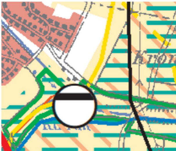
Abbildung 2: Regionalplan, Verband Region Stuttgart