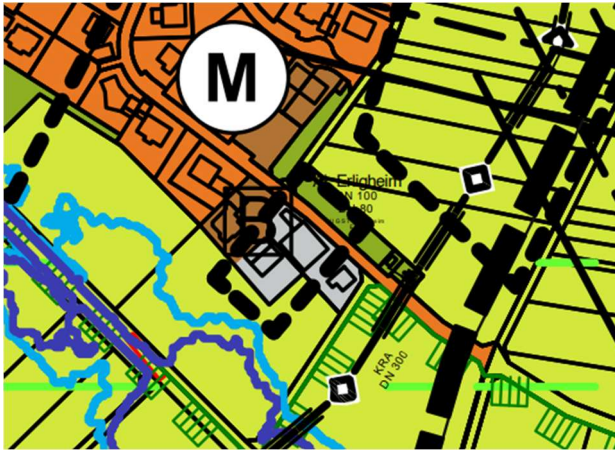
Abbildung 3: Flächennutzungsplan, GVV Bönningheim

Im gültigen Flächennutzungsplan Fortschreibung 2020 bis 2035 des GVV Bönningheim (rechtswirksam seit 03.05.2024) ist der Bereich als bestehende gewerbliche Bauflächen dargestellt. Der Bebauungsplan ist somit nicht aus dem Flächennutzungsplan entwickelt.